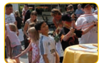
Spiel und Spaß