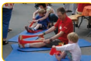
Kinder und Fitness